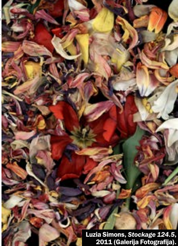
Luzia Simons, Stockage 124.5 , 2011 (Galerija Fotografija).