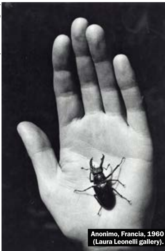
Anonimo, Francia, 1960 (Laura Leonelli gallery).